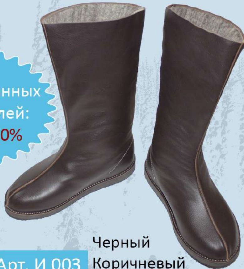
Арт. И 003 Черный Коричневый