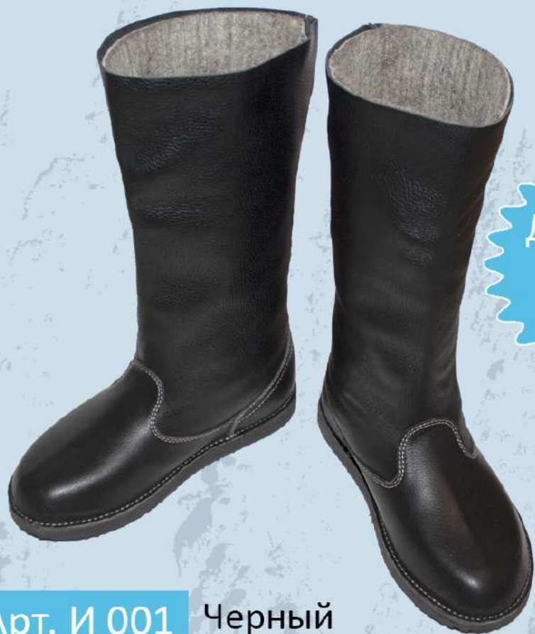
Арт. И 001 Черный