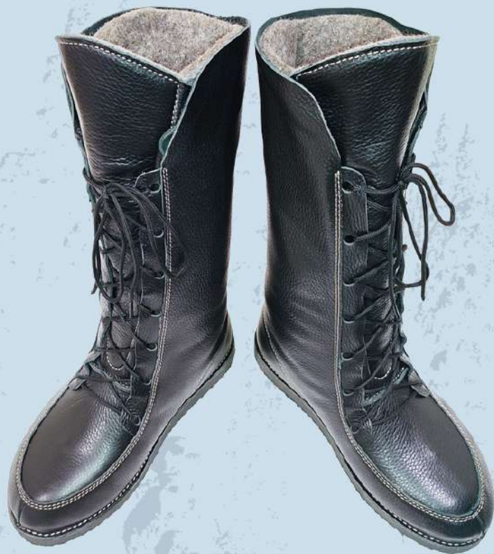
Арт. И 002 Черный